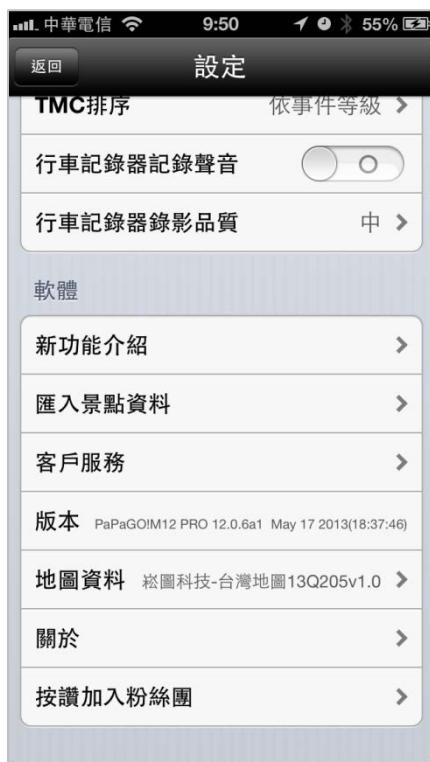
註冊後「升級正式版」字樣已消失